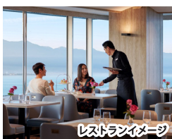
レストランイメージ