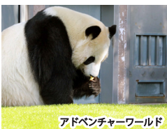
アドベンチャーワールド