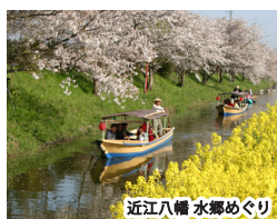
近江八幡 水郷めぐり