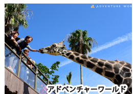
アドベンチャーワールド